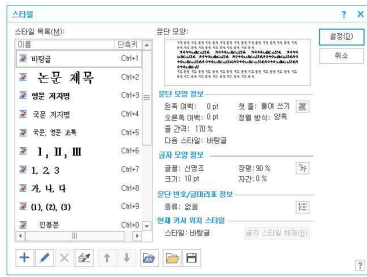
[<F6> 누른 화면]